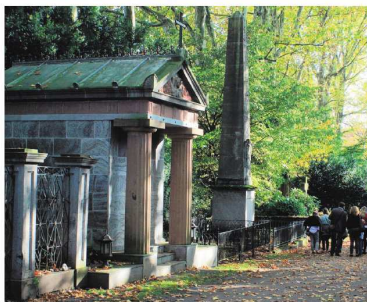
■ Eine Besuchergruppe lauscht Geschichten über den Melaten-Friedhof, der mit mehr als 55.000 Gräbern eine der größten Begräbnisstätten in Deutschland ist.