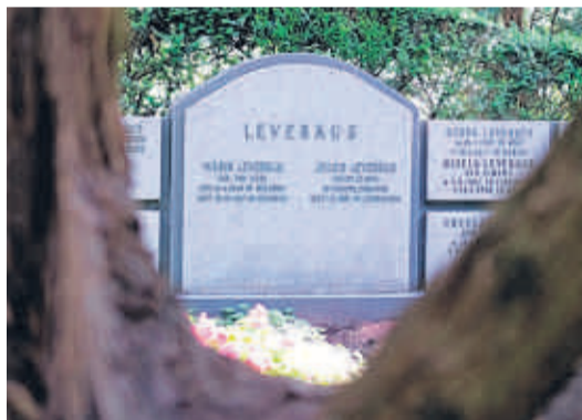
Das Grab der Familie Leverkus