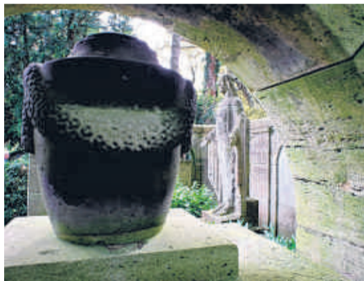
Erinnerungen an Mülheimer Wohlstand