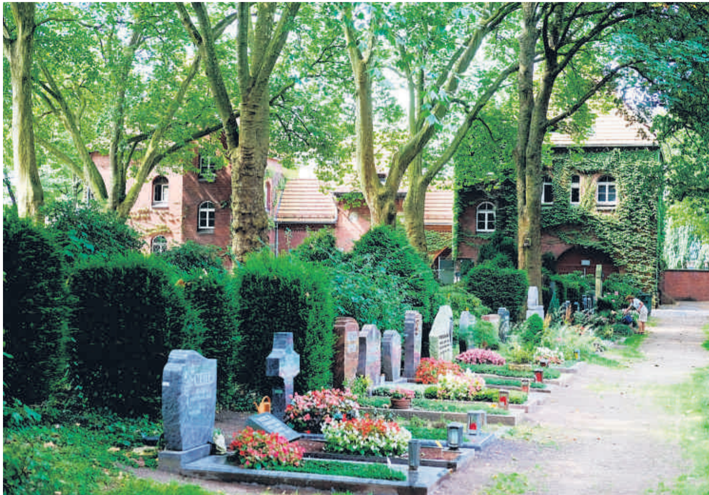
Der prachtvolle Torbau an der Frankfurter Straße ist der Eingang zum Mülheimer Friedhof.

Besichtigen kann man hier auch das Ergebnis des rasanten Wandels