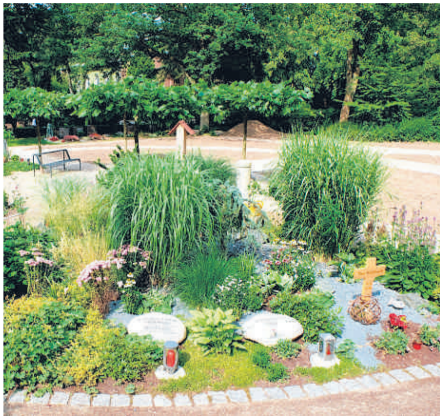
Am Anfang umstritten, heute sehr beliebt: Die Bestattungsgärten werden erweitert.