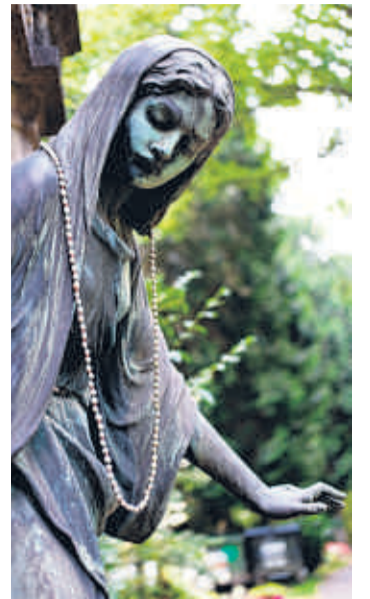
Schmuck für einen Engel