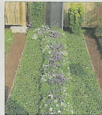
Frühjahr-Wechselbeet: Zum Beispiel mit Männertreu und Bellis