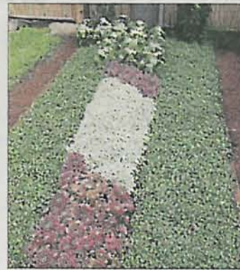
Das Sommerbeet: Kalanchoe, Hauswurz und Gänsekresse.