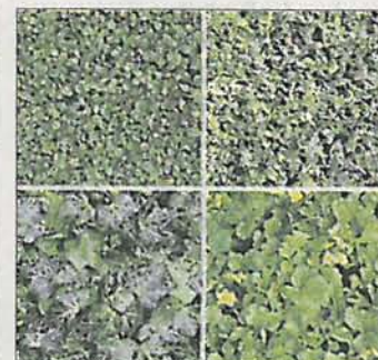
Zwergmispel, Kriechspindel, Efeu und Waldsteine.

(Calluna vulgaris) Herbstheide (Erica gracilis) Winterheide (Erica carnea, Erica x darleyensis) Irische Glockenheide (Daboecia cantabrica) Alpenveilchen Stacheldrahtpflanze (Calcephalus Cultivar) Scheinbeere (Gaultheria procumbens) Blattschmuck: