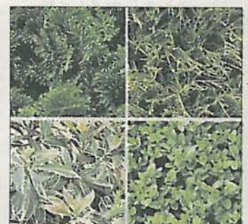
Muschelzypresse, Fadenzypresse, Lavendelheide und Buchs

Heiligenkraut (Santolina chamaecyparissus) Salbei, grünlaubig/buntlaubig/violett (Salvia) Purpurglöckchen (Heuchera) Papageienblatt (Alternanthera) Veronica (Hebe) Gräser und Farne, div. Arten und Sorten (z.B. Carex, Festuca, Acorus) Weitere Infos: www.friedhofsgaertner-koeln.de