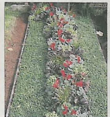
Im Herbst und Winter passen Thymian oder Alpenveilchen.