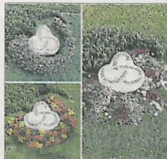
Wechselbepflanzung im Frühling, Sommer und Winter.

procumbens) Isotoma (Isotoma fluviatilis) Steinkraut, Alyssum (Lobularia maritima) Flammendes Käthchen (Kalanchoe blossfeldiana) Blattschmuck: Echeverie (Echeveria) Hauswurz (Sempervivum) Mauerpfeffer (Sedum) Herbst: Sommerheide, Knospenheide